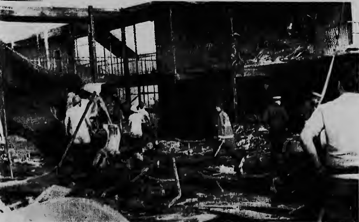
KENNER -- Ruinanan di e avion Delta DC-8 fanjet, na man robes y partinan destrui di kambanan di Hilton Inn Motel por ser mira riba e foto aki, despues cu e avion a cai durante un vuelo di entrenamiento, 18 persona a perde nan bida den e accidente aki.

Dewar's distributors or agents in over 160 countries can arrange to deliver a gift of "White Label" to your friends overseas. Please ask your local distributor for a quotation or, in case of difficulty, write to: John Dewar & Sons Ltd, Dewar House, Haymarket, London SW1, England.